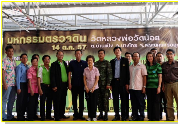
กลุ่มส่งเสริมการจัดการดินปุ๋ย ๑๕ ตุลาคม ๒๕๕๗